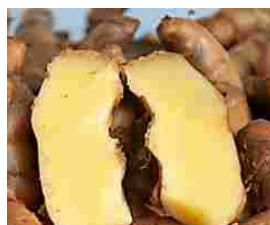
Potentissimo Anti-Tumorale Naturale: Sgonfia tutto il Corp...