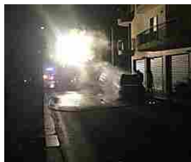
Auto in fiamme su Corso italia