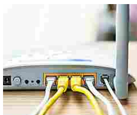
Internet senza Telefono le Migliori 5 Offerte