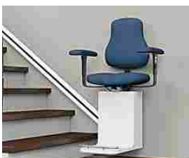
Qui può trovare un montascale conveniente in Mila...