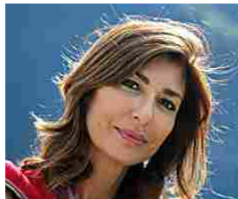
Ecco i lavori più pagati da casa da fare anche solo con il...