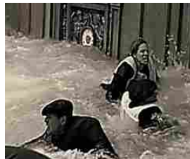
23 foto esclusive del Titanic che vi faranno venire la pelle d'oc...