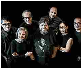
Sentieri selvaggi: il DNA della musica è all'Elfo Puccini