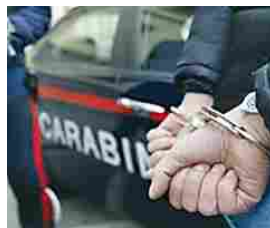
Operazione antimafia tra Policoro e Scanzano J., tra gli arrestati anche un originario di Santeramo